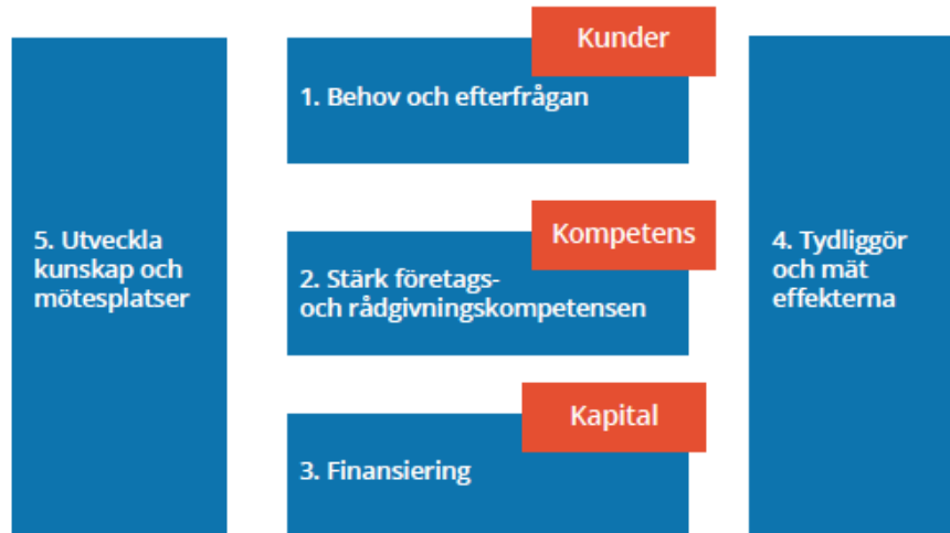
Figur 1. Utvecklingsområden för socialt företagande och social innovation i Sverige. 23

När strategin lanserades fick Vinnova och Tillväxtverket uppdrag att ta fram finansieringsinsatser som skulle stärka utvecklingen av social innovation respektive socialt företagande. 24 Insatserna omfattade stöd till individuella projekt, innovations- och företagsfrämjare, intermediärer, finansiärer, akademi m.fl.